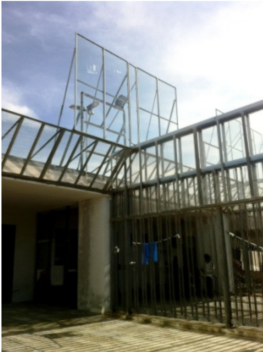
Area maschile: pannelli trasparenti recentemente collocati nella parte superiore delle recinzioni di ogni settore

spesso la divisione tra i vari spazi era assicurata solo da grandi plastiche nere simili a quelle di buste per la raccolta dei rifiuti.