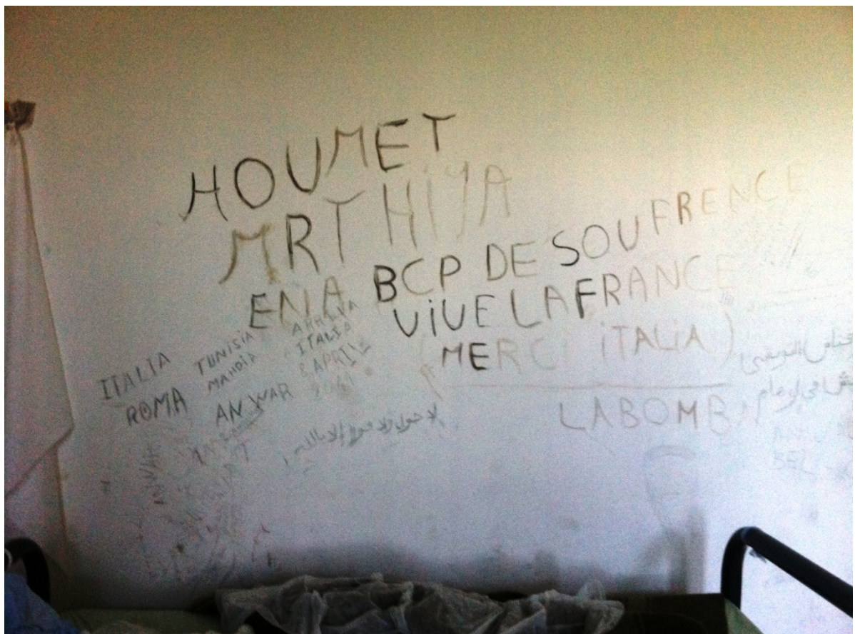
Particolare di una camerata dell'area maschile