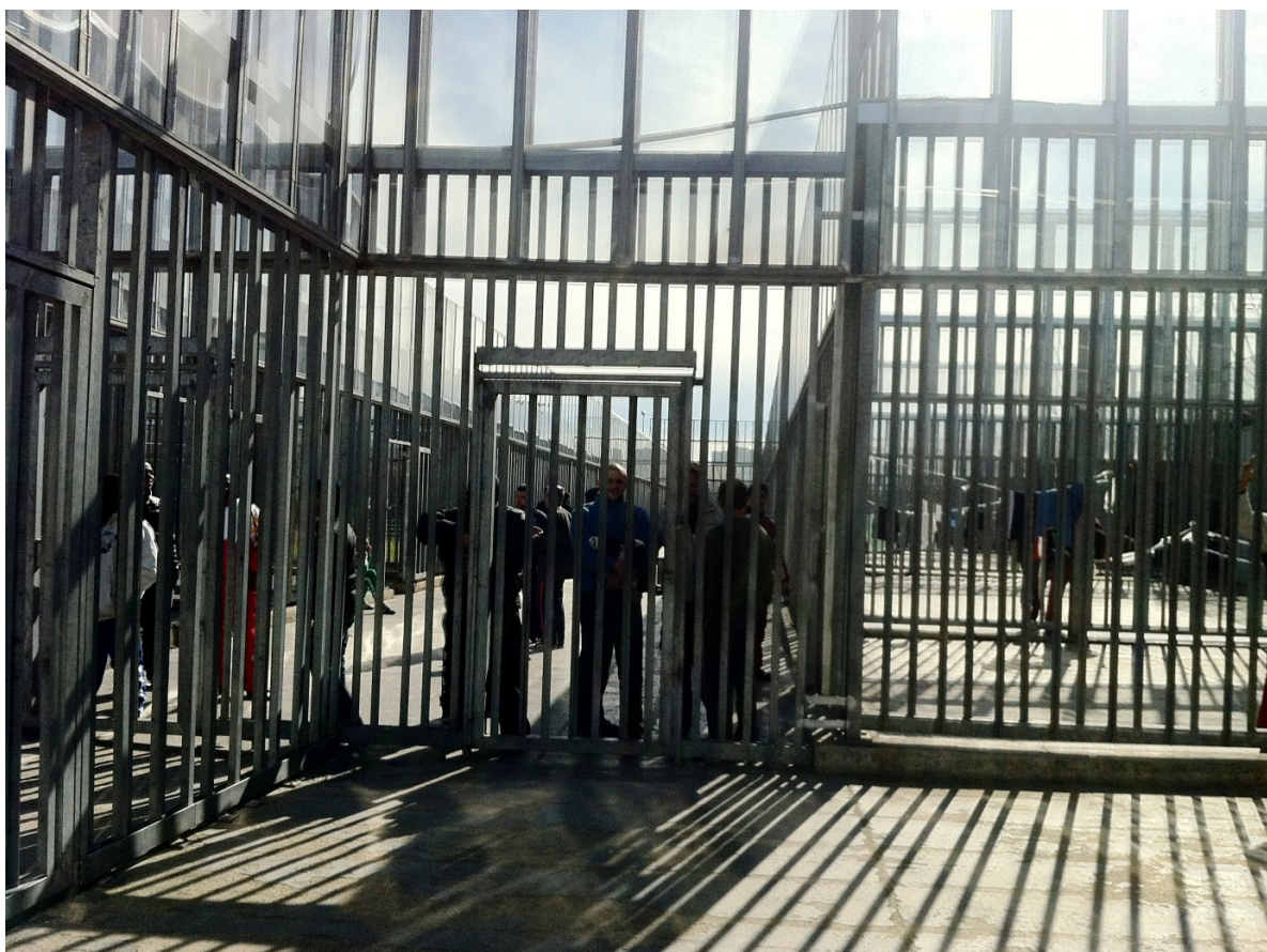
Ingresso dell'area di trattenimento maschile