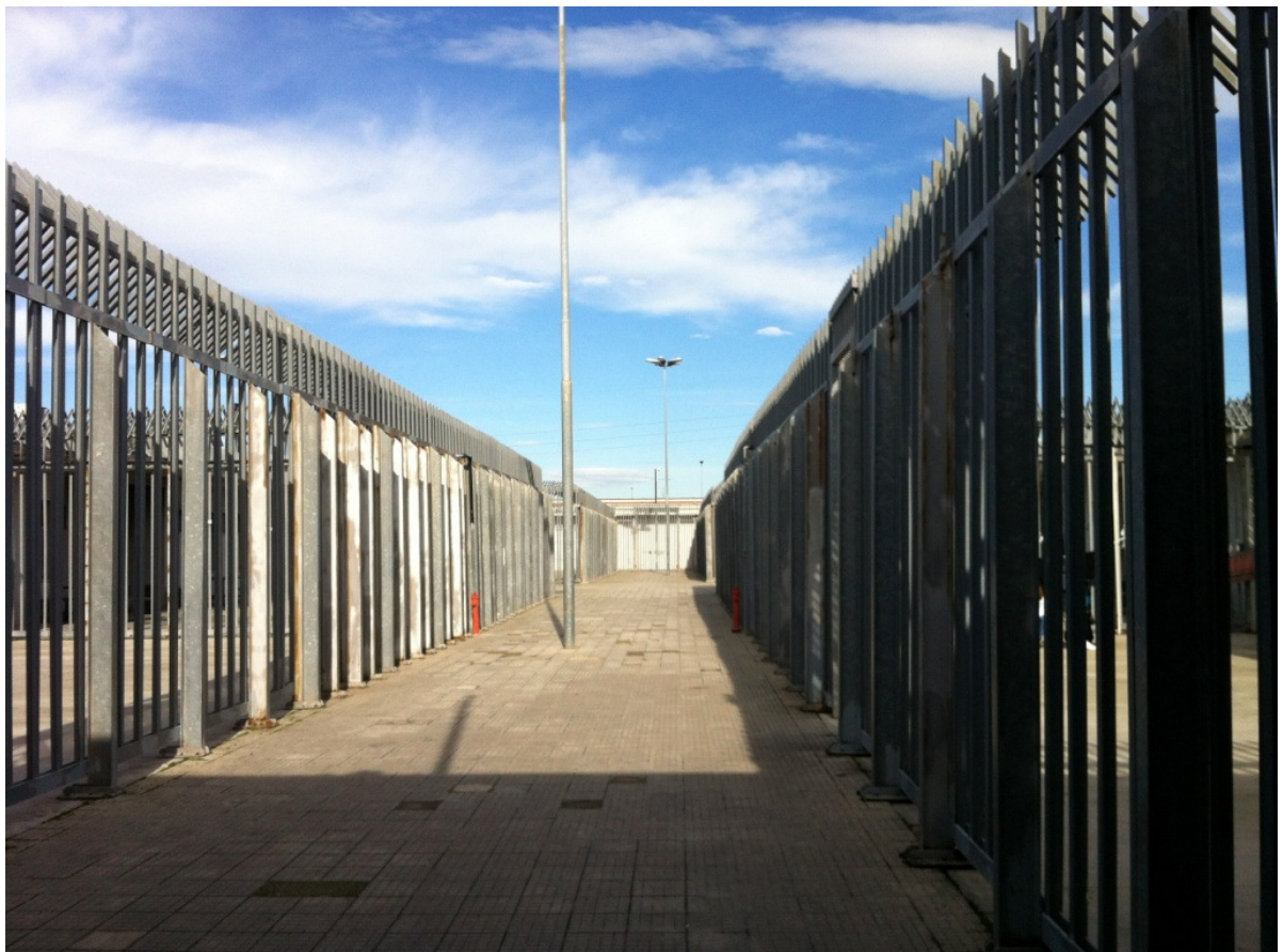
Area femminile: corridoio esterno di collegamento dei diversi settori