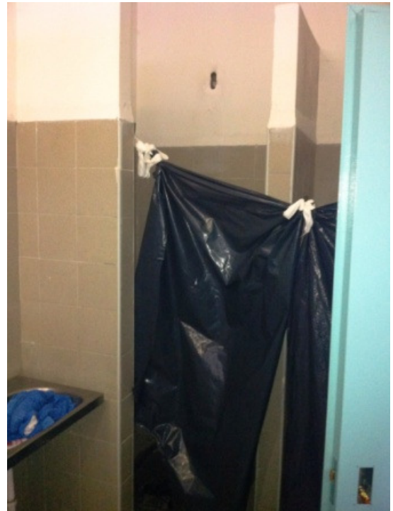
Area maschile: bagni e docce di una camerata